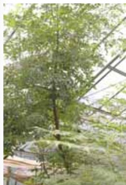
ニーム(インドセンダン)